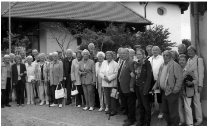
Am Ende des Ausflugs, glücklich über den Nachmittag, den sie gemeinsam in froher Runde verbringen konnten.